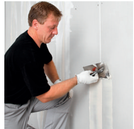
PCI Muroplan – vielseitig anwendbarer Gips-spachtel.